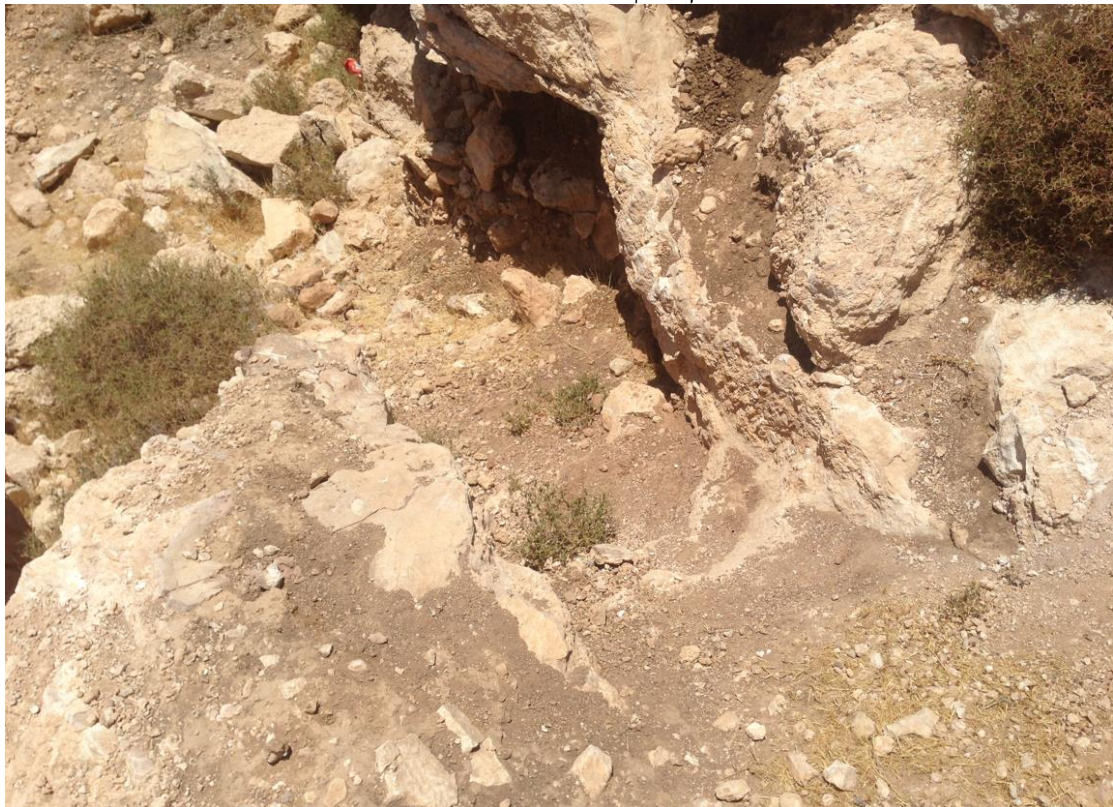
איתור 4 – דרום מזרח חצוב בכניסה למערת מגורים.