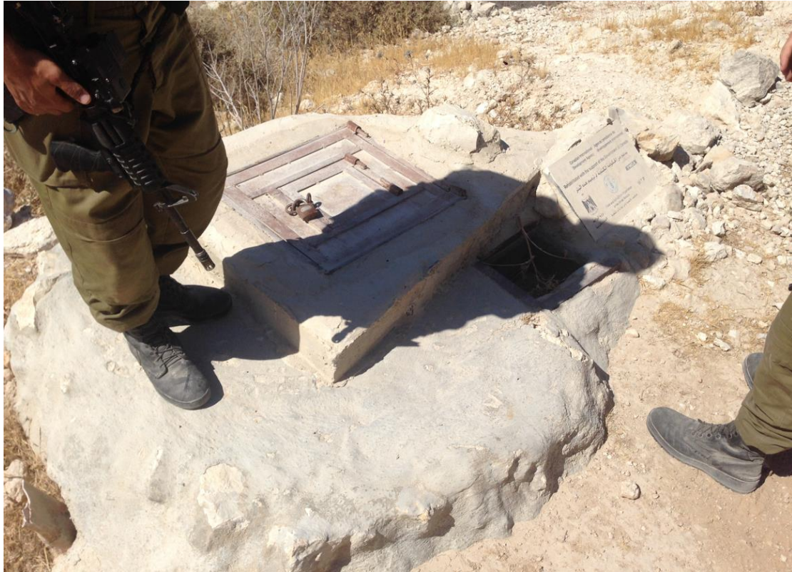
איתור 1 – בור מים.