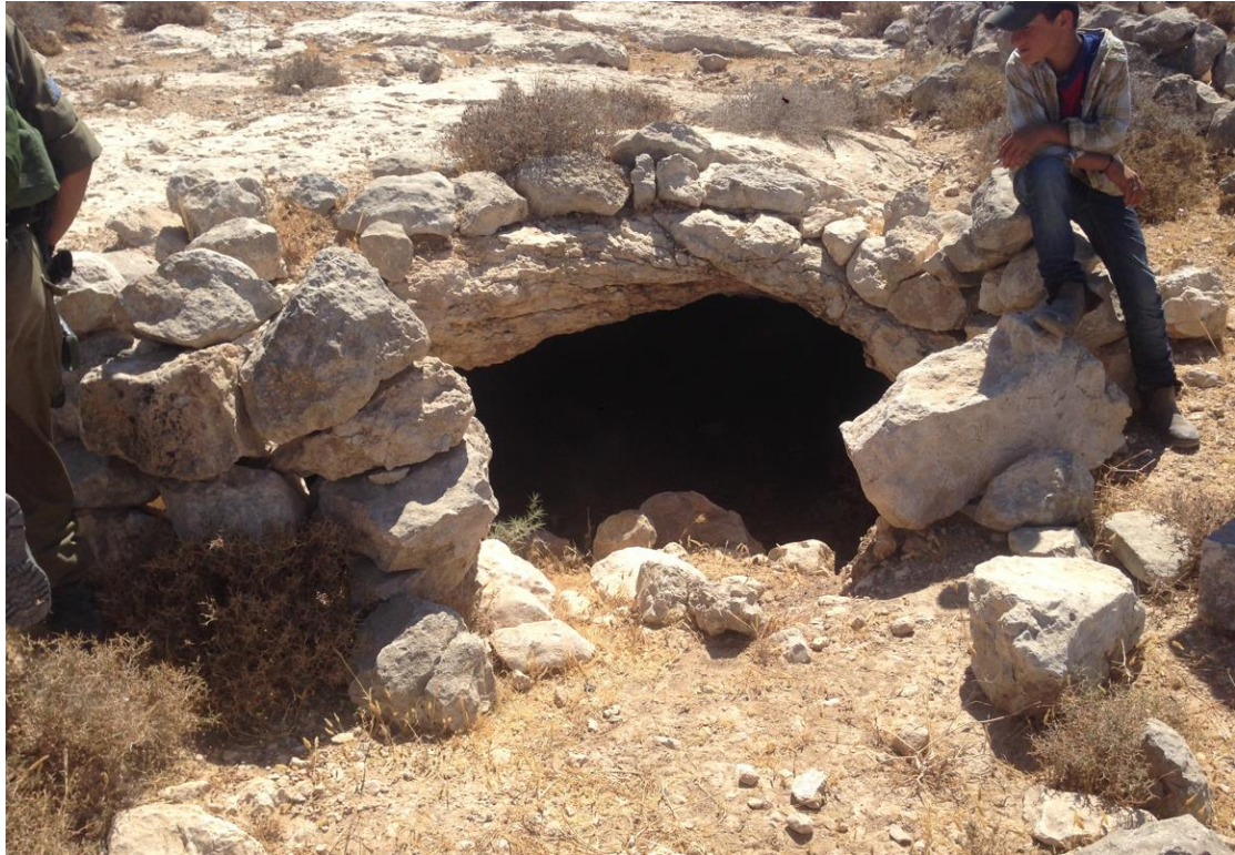
איתור 7 – מערה.