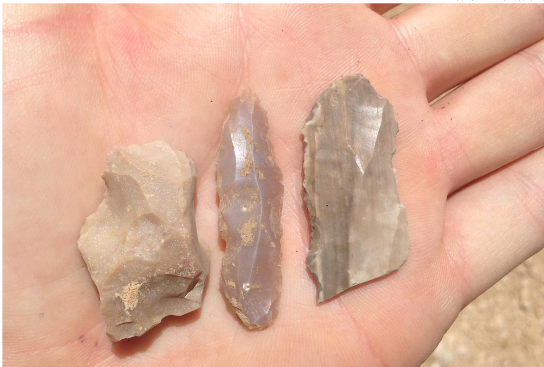
מבחר כלי צור שנאספו בסקר.