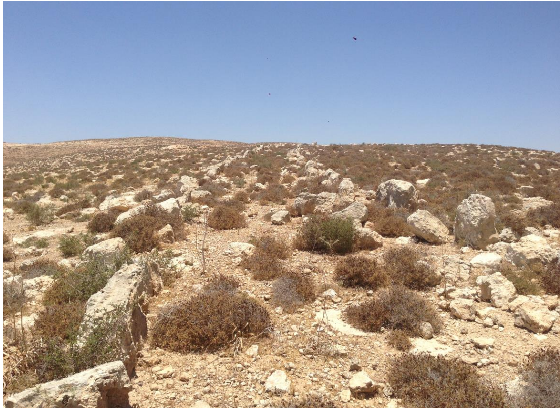
איתור 5 – דרך קדומה.