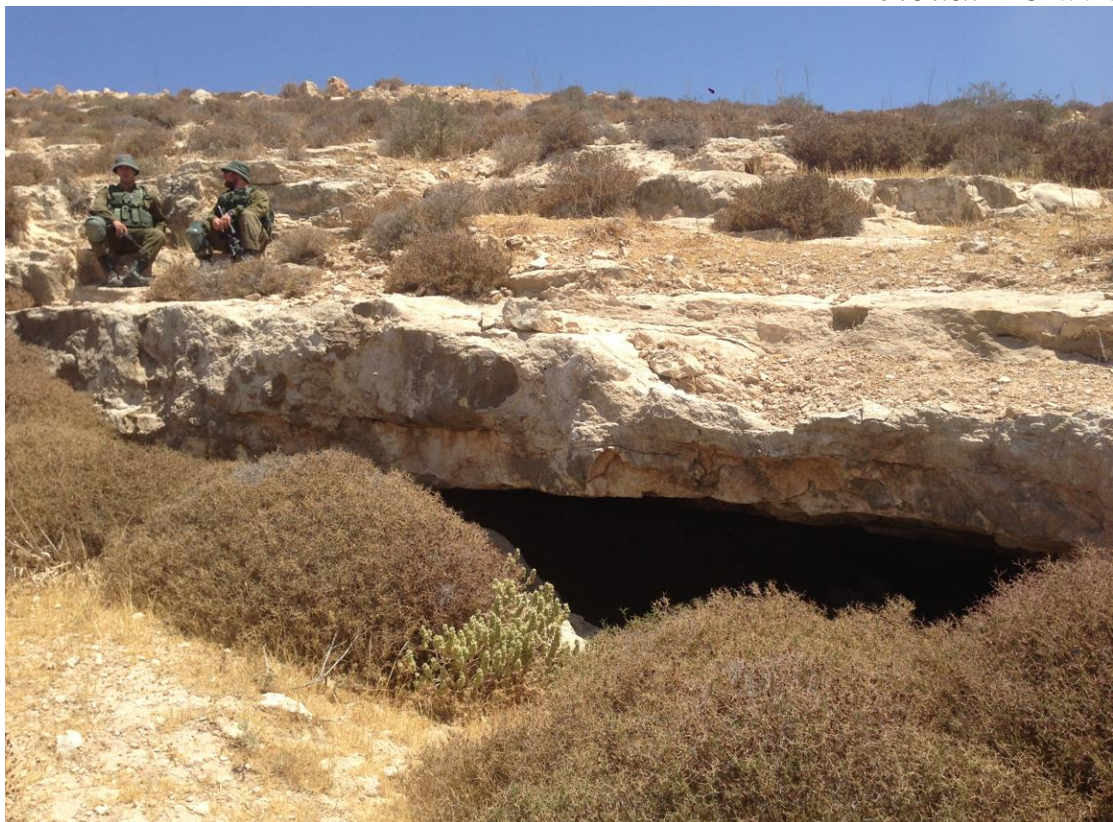
איתור 3 – מערה.