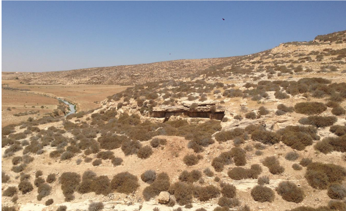
איתור 3 – מחסה סלע.