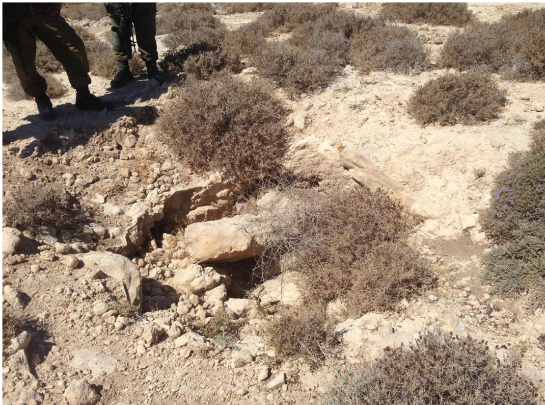
איתור 2 – טומולוס?