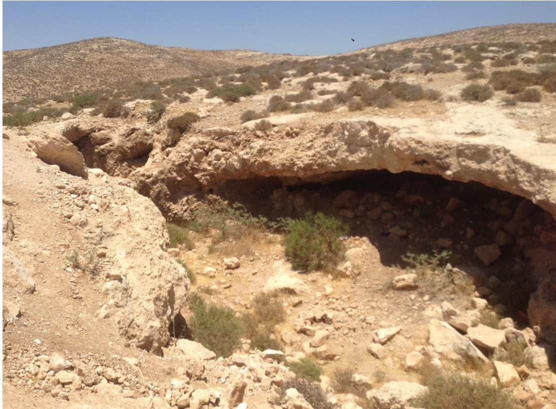
איתור 4 – מערת מגורים ממוטטת באופן חלקי.